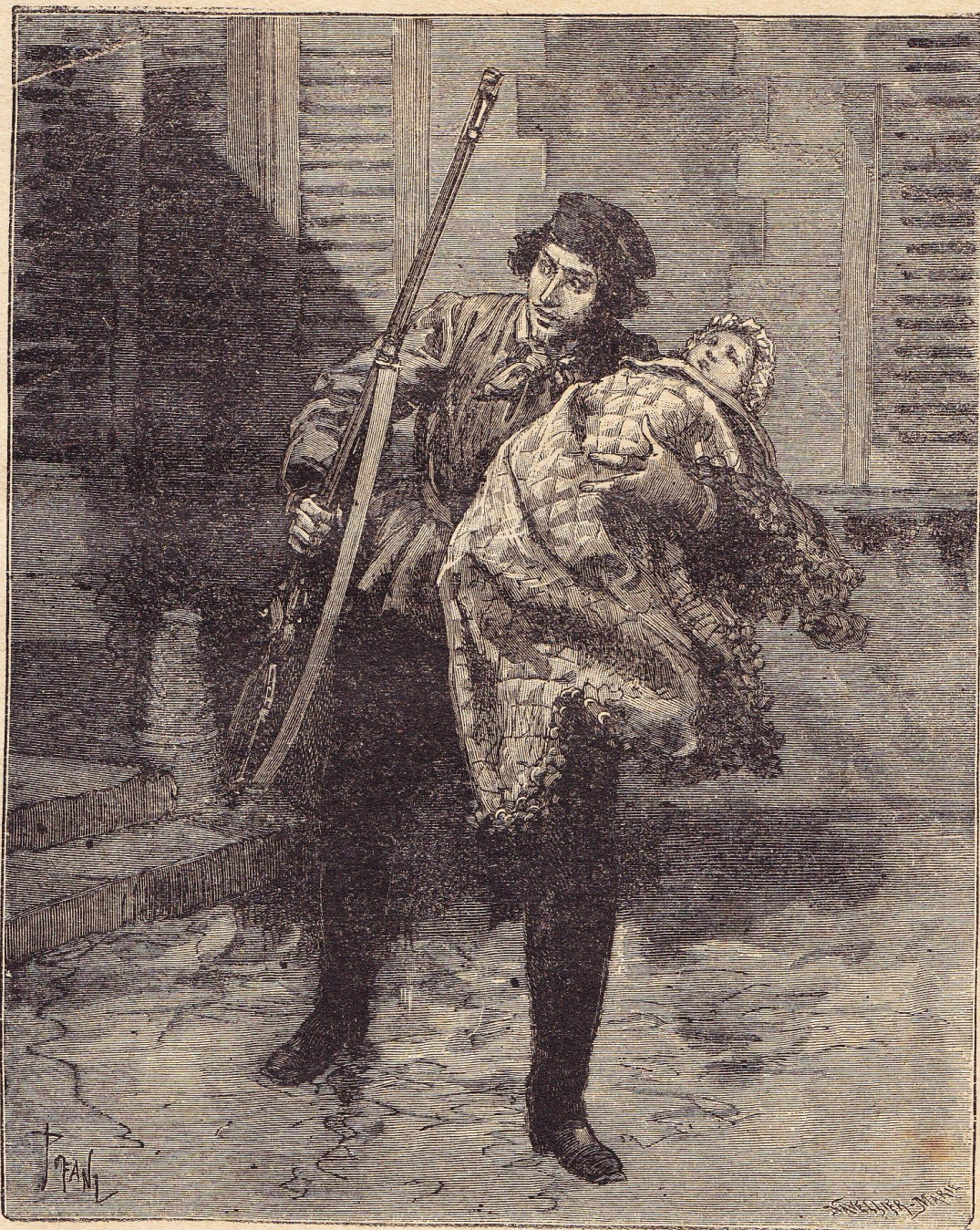
Koortsig is hij de binnenplaats overgelopen.

Koortsig is hij de binnenplaats overgelopen tot aan het koetshuis, waar hij zijnen lichten last neerlegt.