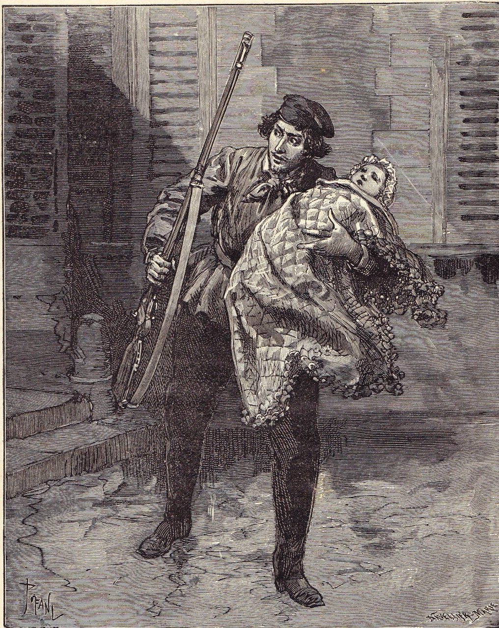
Fiévreusement, il a traversé la cour. (Page 40.)

Et, comme pour s'encourager à poursuivre l'accomplissement de l'horrible tâche, il se rappelle ces mots prononcés tout à l'heure par le comte : « Nous n'avons pas pour plus de dix minutes de travail... »